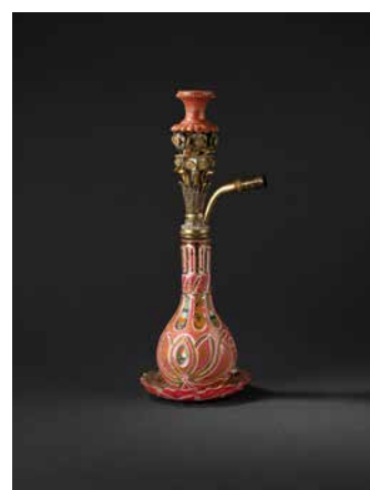
19. Narguilé. Fin du XIX e - début du XX e siècle. Tchéquie (Bohême) et Istanbul, Turquie. Verre multicolore gravé, doré et peint, métal argenté et doré, terre cuite