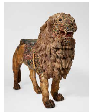
8. Sujet de manège en forme de lion. 1895-1900. Washington, États-Unis. Bois sculpté, verre coloré