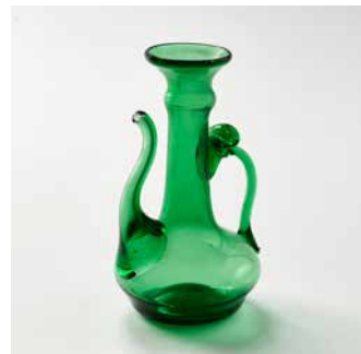
Briik , burette à huile d'olive. Soufflerie Abou Ahmad. 2003. Damas, Syrie. Verre coloré soufflé