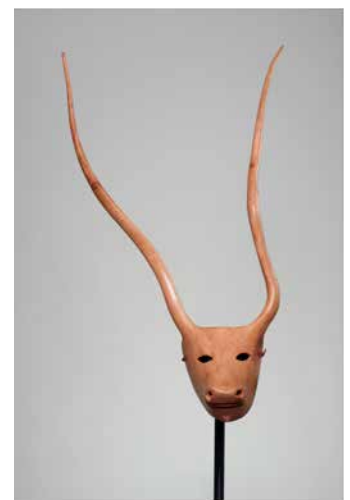
9. Masque de Boe (Boeuf). Gonario Denti, sculpteur. 2005. Ottana, Sardaigne, Italie. Bois sculpté et peint, cuir