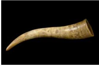
Corne gravée. Début du XX e siècle. Espagne. Corne, liège