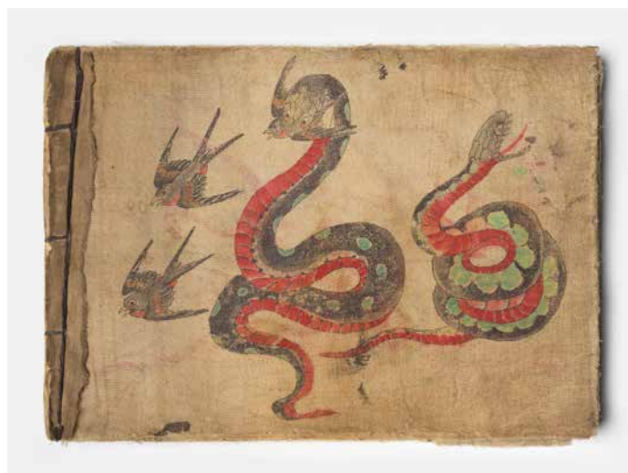
11. Carnet de modèles de tatouages. Début du XX e siècle. États-Unis ? Percale de coton peinte

À la manière d'un palimpseste, l'artiste Endri Dani a reproduit sur une bétonnière des motifs aux couleurs vives qu'il avait relevés dans une maison sur le point d'être détruite. Ces motifs décoratifs issus de la tradition albanaise se retrouvent aussi dans les productions textiles, notamment les tabliers.