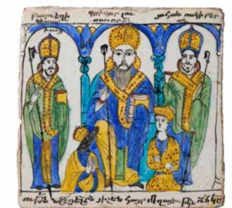
14. Carreau aux trois saints hiérarques. 1718-1719. Kütahya, Turquie, Anatolie. Céramique siliceuse à décor peint sous glaçure transparente et incolore