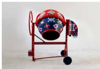
10. Palimpsest - 01. Endri Dani. 2010. Albanie. Métal peint © Endri Dani