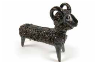
12. Gourde. Début du XX e siècle. Serbie. Terre cuite glaçurée. Collection d'ethnologie d'Europe, dépôt du Muséum national d'histoire naturelle