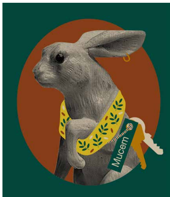
Phil, héros de l'espace enfants © Mucem / Direction artistique Jaune Sardine & Fabrication Les Marsiens

Conception et aménagement de l'espace enfant Jeux et scénographie : Jaune Sardine Fabrication : Les Marsiens