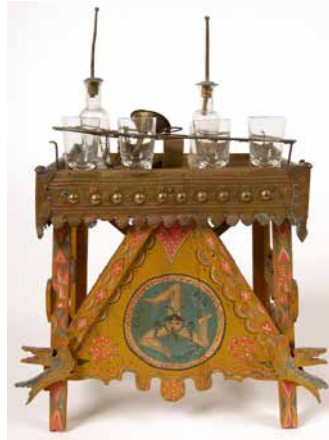
Table de marchand de sirop ambulante. Début du XX e siècle. Palerme, Italie. Verre incolore, bois peint, métal. Collection d'ethnologie d'Europe, dépôt du Muséum national d'histoire naturelle