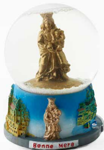
18. Boule à neige. Début du XXI e siècle. France. Plastique, résine, verre, polystyrène et eau

La technique dite de la fleur perlée française est née dans les ateliers de Murano, à Venise. Elle s'établit ensuite en France, pour créer aux XIX e et XX e siècles des compositions utilisées lors de baptêmes, de mariages et particulièrement de funérailles. Cet artisanat était exercé, en atelier ou à domicile, par des femmes.