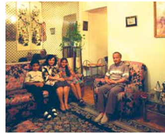
6. Série photographique représentant des familles à Alexandrie. Alain Leloup. 1997. Égypte, Alexandrie