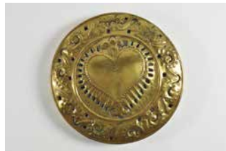
15. Bassinoire à couvercle. XVII e siècle. France. Cuivre jaune gravé et ajouré