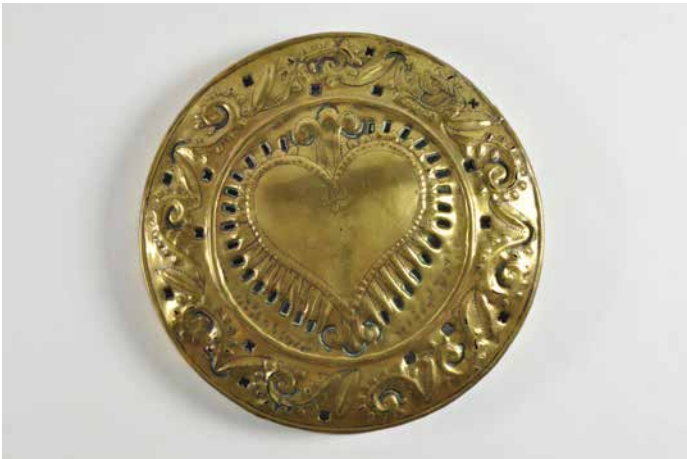
15. Bassinoire à couvercle. XVII e siècle. France. Cuirre jaune gravé et ajouré

Les fonds conservés par le Mucem permettent de montrer comment, avant l'industrialisation et la mécanisation généralisée des techniques, chaque objet, unique, est issu d'une commande directe de l'utilisateur à l'artisan. Les objets en métal, auxquels la résistance et la ductilité donnent un pouvoir particulier, permettent d'agir sur le monde environnant.