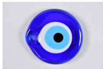
5. Amulette dite nazar boncuk . Début du XXI e siècle. Kemalpaşa, province d'Izmir, Turquie. Verre soufflé