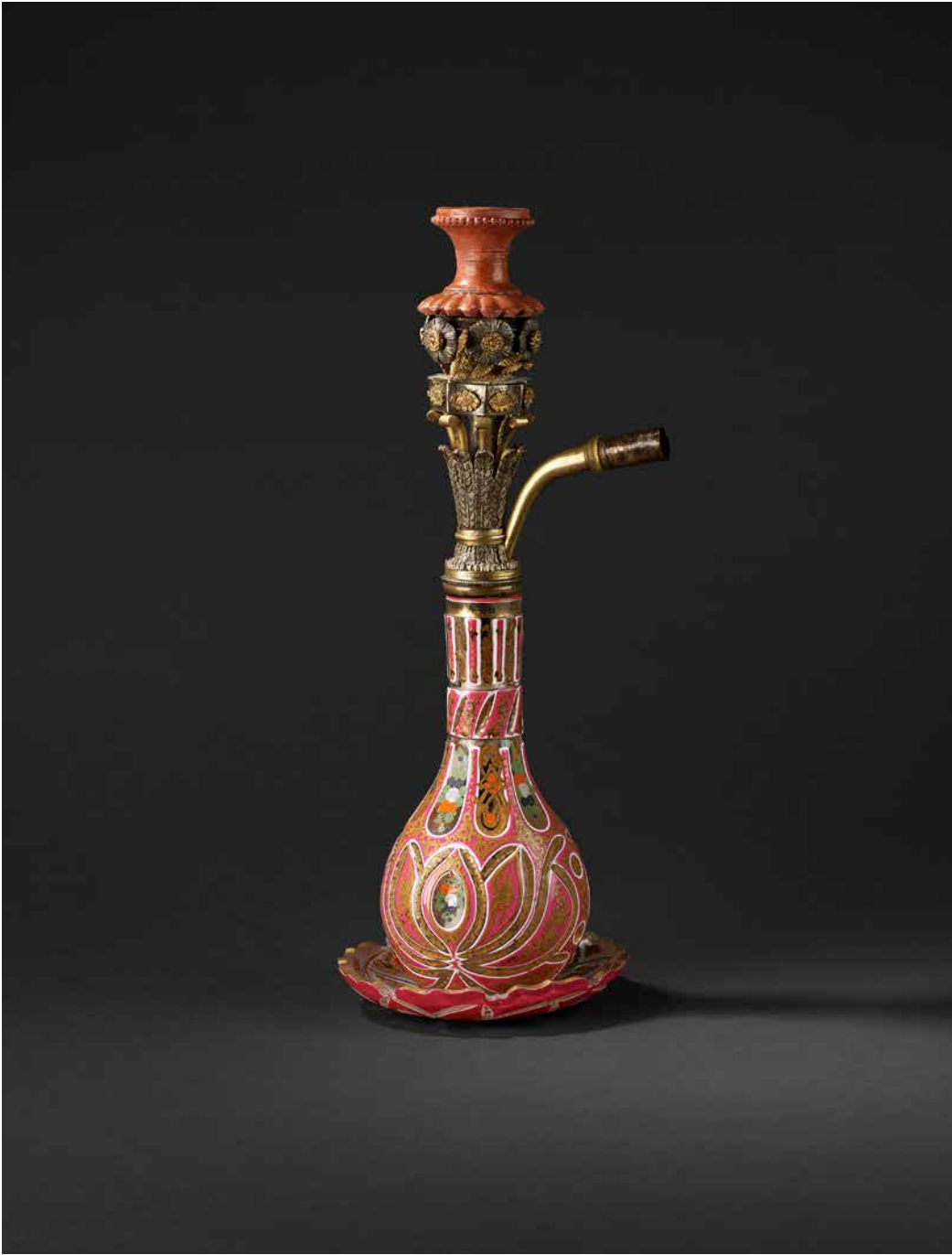
19. Narguilé. Fin du XIX e - début du XX e siècle. Tchéquie (Bohême) et Istanbul, Turquie. Verre multicolore gravé, doré et peint, métal argenté et doré, terre cuite

Le narguilé est aujourd'hui très répandu dans la Méditerranée et au-delà. Dans l'Empire ottoman, hommes et femmes le fumaient. Le vase en verre provient de Bohême, le fourneau en terre cuite de Tophane, à Istanbul. Ce narguilé était un objet précieux féminin utilisé à la maison.