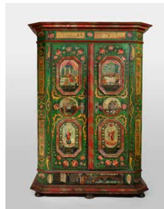
7. Armoire. 1840. Zillertal, Tyrol, Autriche. Bois peint