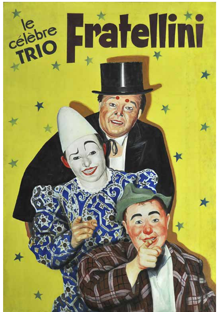
4. Affiche pour la façade du Cirque d'Hiver de Paris, le célèbre trio Fratellini (Kiko, Gino et Baba) Renaud Gilbert (peintre), Publidécor (entreprise). Début 1965