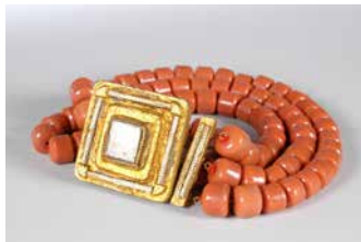
1. Collier. 1 ère moitié du XX e siècle. Volendam, Pays-Bas. Perles de verre, métal, bois doré. Collection d'ethnologie d'Europe, dépôt du Muséum national d'histoire naturelle

Toute autre exploitation des images (commerciale ou non) devra faire l'objet de la part du diffuseur d'une demande d'autorisation auprès des ayants-droits.