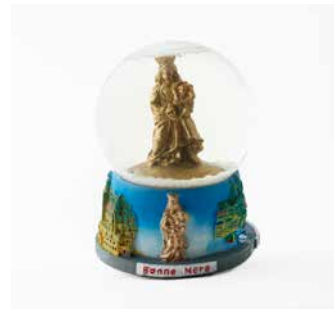
18. Boule à neige. Début du XXI e siècle. France. Plastique, résine, verre, polystyrène et eau