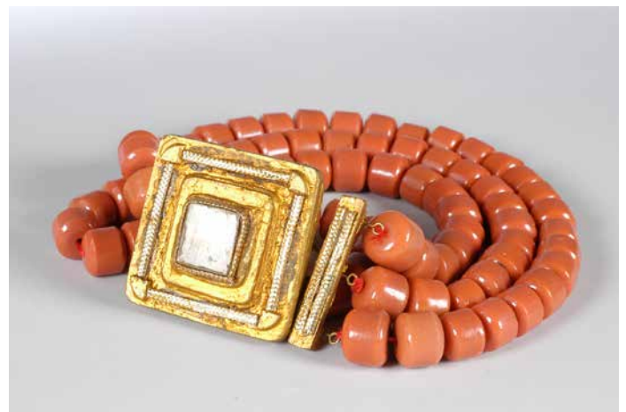
2. Collier. 1 ère moitié du XX e siècle. Volendam, Pays-Bas. Perles de verre, métal, bois doré. Collection d'ethnologie d'Europe, dépôt du Muséum national d'histoire naturelle