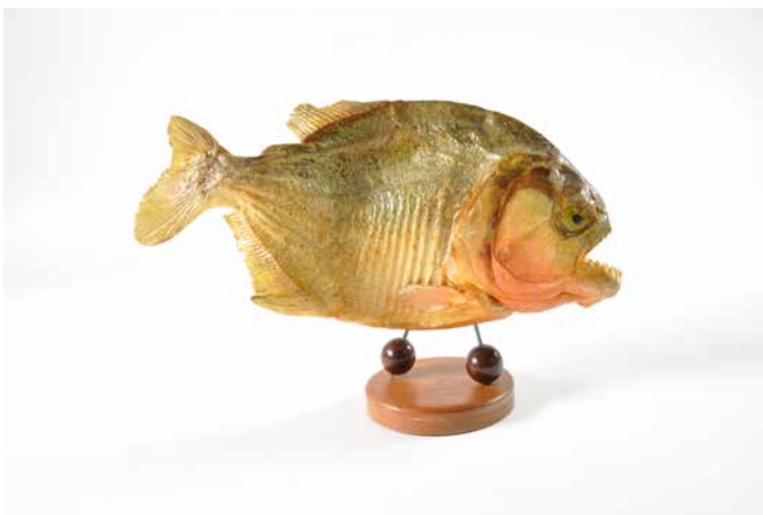
1. Piranha naturalisé. XX e siècle. Matériau d'origine animale, verre, fer, bois © Mucem

La plupart des matières présentes dans les collections sont protégées par la Convention sur le commerce international des espèces de faune et de flore sauvages menacées d'extinction, dite Convention de Washington, en vigueur depuis 1975.