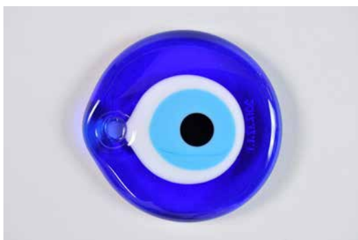
5. Amulette dite nazar boncuk . Début du XXI e siècle. Kemalpaşa, province d'Izmir, Turquie. Verre soufflé

Les collections du Mucem regroupent des objets qui témoignent du rôle de protection que l'habitat doit jouer pour protéger ceux qui y vivent des dangers climatiques ou symboliques et de sa capacité à abriter la vie intime.