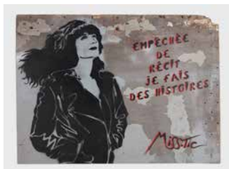
3. Empêchée de réciter, je fais des histoires. Miss.Tic. 2012. Paris, France. Peinture à la bombe et au pochoir sur bois © MISS TIC - Adagp / Paris, 2023