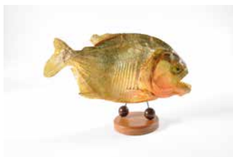
2. Piranha naturalisé. XX e siècle. Matériau d'origine animale, verre, fer, bois