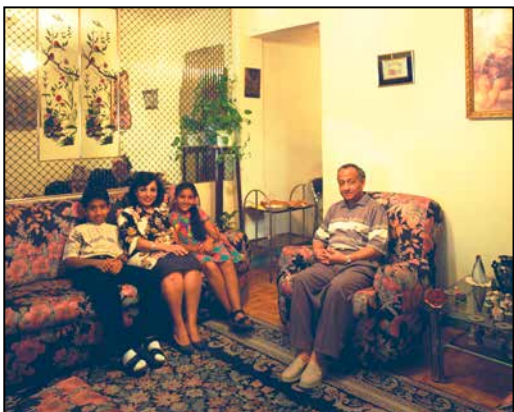
6. Série photographique représentant des familles à Alexandrie. Alain Leloup. 1997. Égypte, Alexandrie © Alain Leloup/Mucem

Cette amulette, dont la forme évoque un œil, protège contre le mauvais esprit associé aux individus aux yeux bleus dans la croyance populaire ottomane. En Turquie, en Arménie, en Iran ou en Grèce, elle est suspendue au-dessus des portes d'entrée, sur les murs des maisons ou encore dans les véhicules.