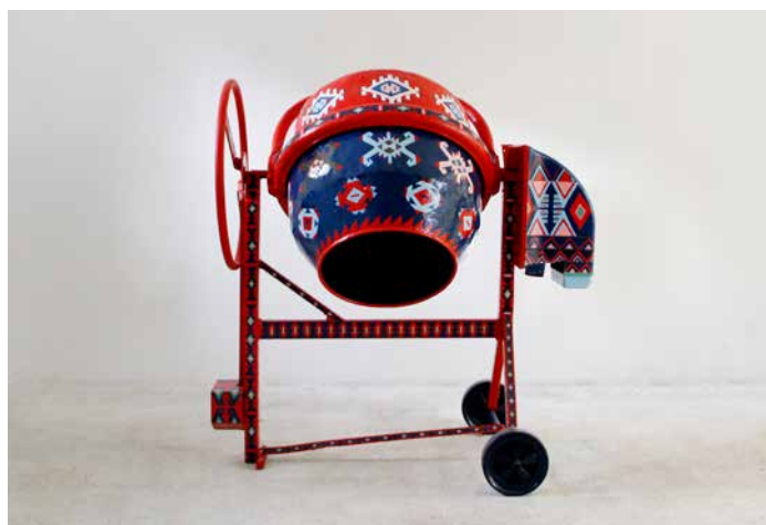
10. Palimpsest_01 . Endri Dani. 2010. Albanie. Métal peint © Endri Dani

Les collections comptent un nombre important de vêtements, accessoires, bijoux, mais aussi d'objets relatifs à tout ce qui « habille » la peau (maquillage, tatouage, parfum, bronzage). Ces pièces disent une appartenance à un groupe, à une communauté, en même temps qu'ils expriment une singularité.