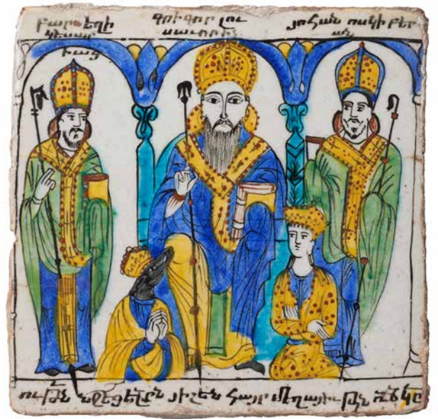
14. Carreau aux trois saints hiérarques. 1718-1719. Kütahya, Turquie, Anatolie. Céramique siliceuse à décor peint sous glaçure transparente et incolore

La fontaine de propreté est une réserve d'eau murale, fermée par un couvercle et munie d'un robinet. Elle sert à l'hygiène, notamment pour se laver les mains. Elle est alors accompagnée d'un bassin qui recueille l'eau utilisée.