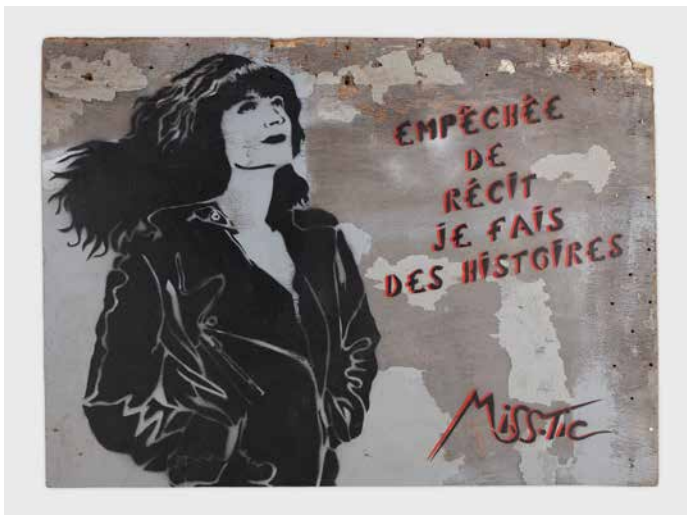
3. Empêchée de réciter, je fais des histoires. Miss.Tic. 2012. Paris, France. Peinture à la bombe et au pochoir sur bois © MISS TIC - Adagp/Paris, 2023

Dans les collections du Mucem, les peintures dites « de chevalet » côtoient le graffiti, les objets usuels ornés ou les décors de boutiques. Les œuvres et objets tantôt réutilisent des poncifs, des motifs répétés, tantôt laissent place à une part d'originalité et de création, situant ces productions au carrefour des pratiques artisanale et artistique.