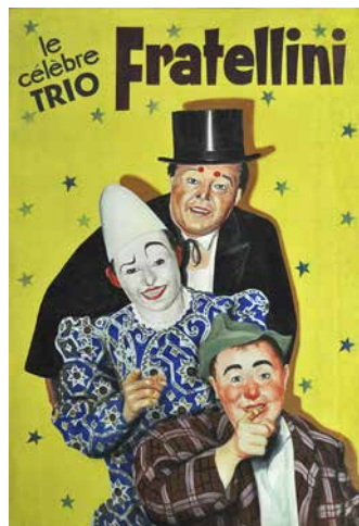
4. Affiche pour la façade du Cirque d'Hiver de Paris, le célèbre trio Fratellini (Kiko, Gino et Baba) France. Renaud Gilbert (peintre), Publidécor (entreprise). Début 1965