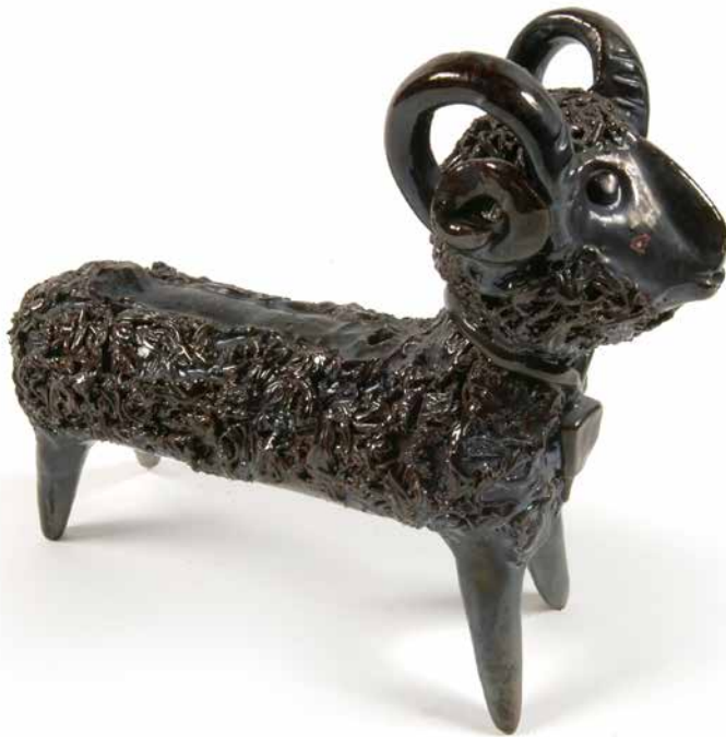
12. Gourde. Début du XX e siècle. Serbie. Terre cuite glaçurée. Collection d'ethnologie d'Europe, dépôt du Muséum national d'histoire naturelle

Chaque pièce conservée par le Mucem porte l'empreinte de son créateur ou sa créatrice, rendant la frontière floue entre pratique artisanale et pratique artistique. Autrefois omniprésente, la terre cuite a connu un net déclin face aux transformations induites par la société de consommation et l'avènement du plastique, mais un « retour à la terre », plus durable, s'envisage désormais.