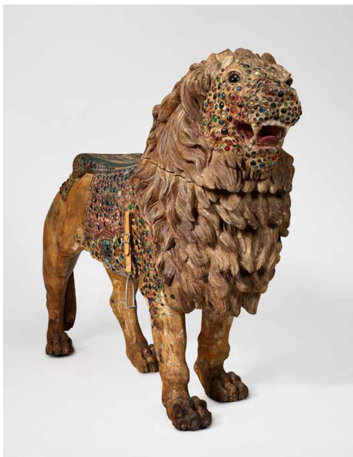
8. Sujet de manège en forme de lion. 1895-1900. Washington, États-Unis. Bois sculpté, verre coloré

Les collections du Mucem sont riches de pièces de sculpture populaire représentant le vivant: hommes et femmes, animaux, créatures hybrides. Elles en illustrent les rapports et les rencontres, permettant de réinterroger la porosité des frontières entre ces différentes catégories.