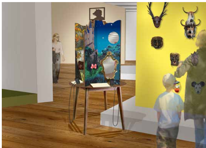
Projet - Cabinet des masques

Conception et réalisation: Chouette fluo et Esprit Volume