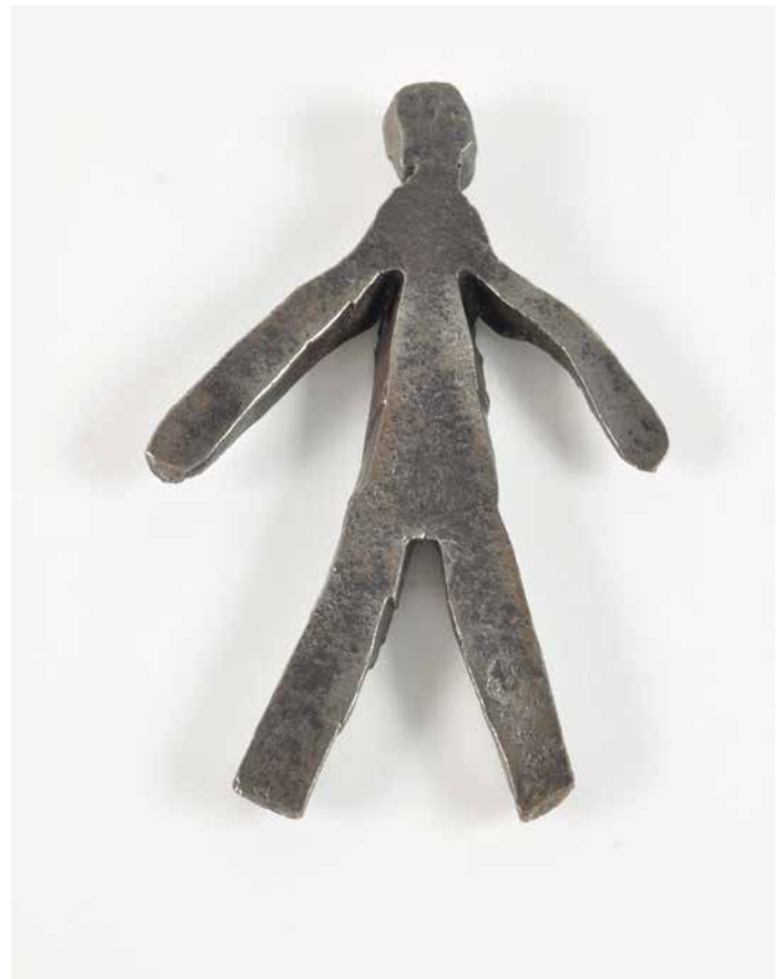
16. Ex-voto. Début du XX e siècle. Saint-Genest, Vosges, France. Fer forgé

Depuis la fin du Moyen Âge, les bassinoires étaient utilisées pour chauffer les lits avant d'aller se coucher. Garnies de braises elles étaient dotées d'un long manche pour pouvoir être glissées jusqu'au fond du lit, de manière à en ôter l'humidité.