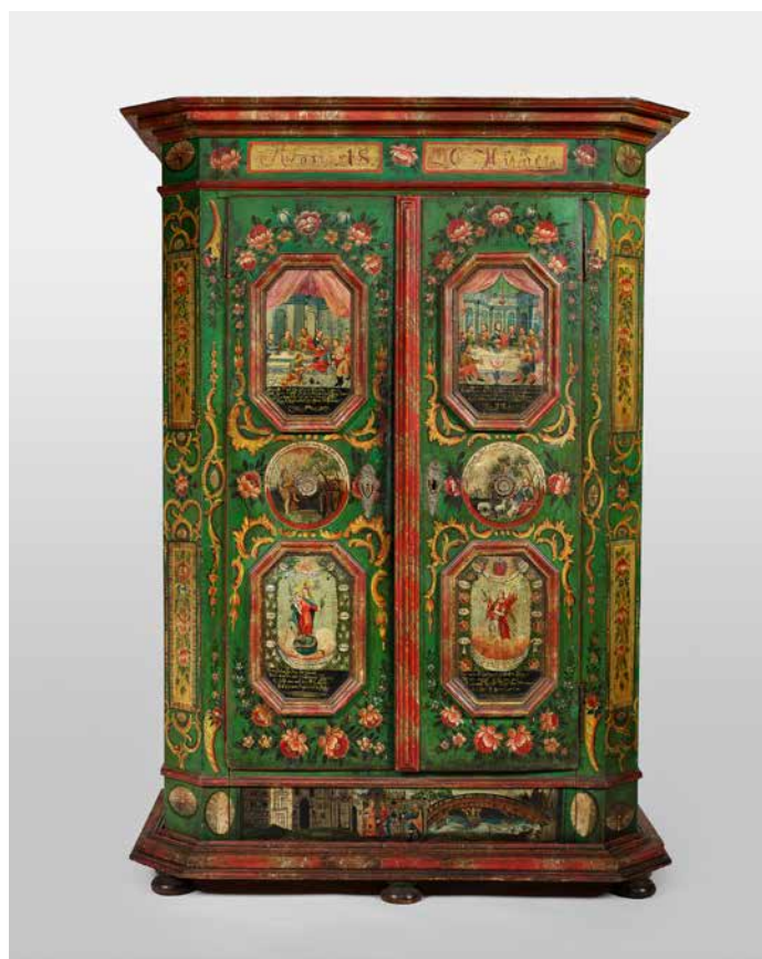
7. Armoire. 1840. Zillertal, Tyrol, Autriche. Bois peint

Ces familles alexandrines posent dans leur salon, cuisine, chambre ou salle à manger. Ces clichés sont réalisés selon un même protocole appliqué à dix-neuf familles. Ils témoignent des modes de vie d'une classe moyenne alexandrine, entre souvenirs du monde ottoman et occidentalisation des modes de vie.