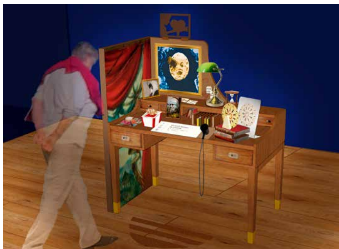
Projet - Le petit bureau du cinéma