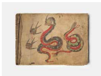
11. Carnet de modèles de tatouages. Début du XX e siècle. États-Unis ? Percale de coton peinte