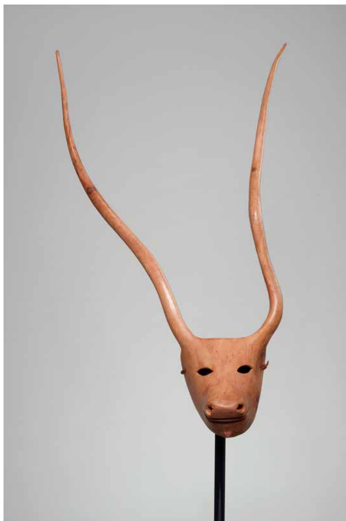
9. Masque de Boe (Boeuf). Gonario Denti, sculpteur. 2005. Ottana, Sardaigne, Italie. Bois sculpté et peint, cuir