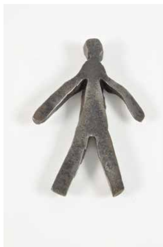
16. Ex-voto. Début du XX e siècle. Saint-Genest, Vosges, France. Fer forgé