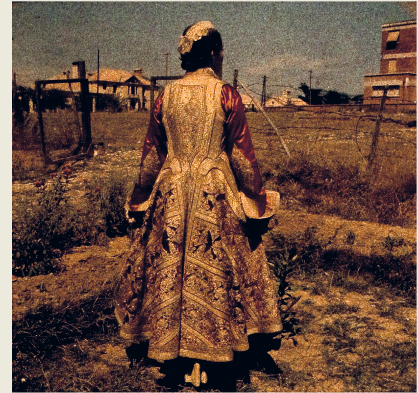
Costume de femme albanaise, 1938. Musée de l'Homme Jacqueline Bénézech et René Bénézech © musée du quai Branly - Jacques Chirac

Mucem, collection d'ethnologie d'Europe, dépôt du Muséum national d'histoire naturelle, Marseille Inv. DMH.D1955.8.93, don de Colette Jankovic