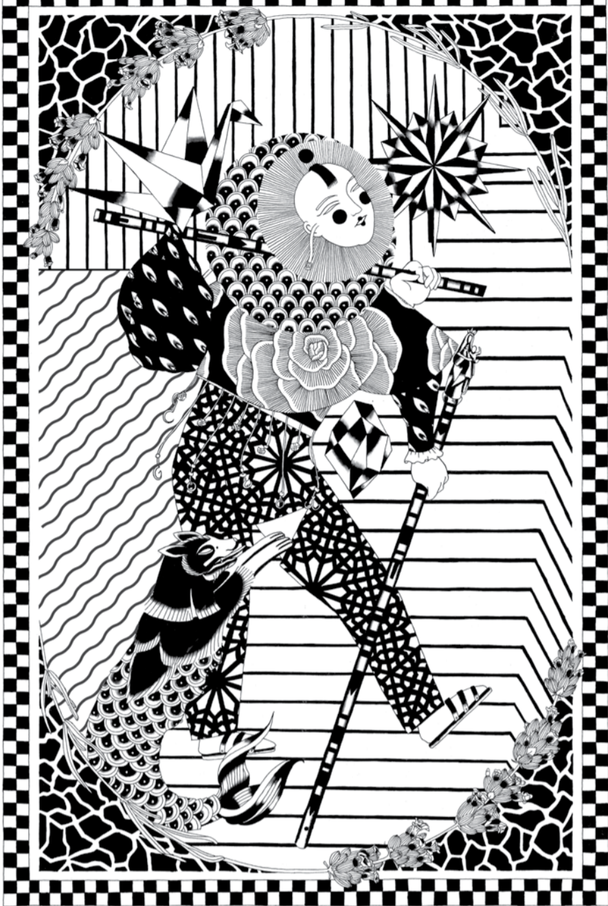
Visuel La Troisième Main